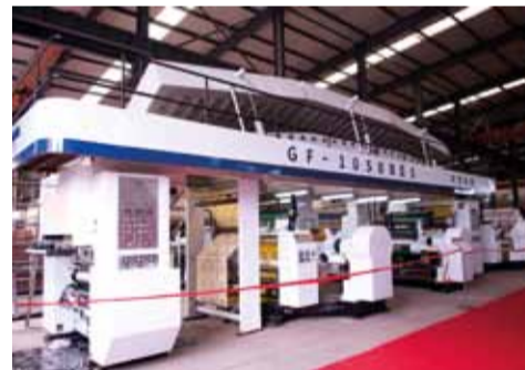
A machine of the Huaying portfolio Eine Anlage aus dem Huaying-Portfolio

This really is a hot story: During an interview with ICE daily the management of the Swiss Polytype Converting AG and the Chinese Huaying Soft-Packing Equipment Plant Ltd. exclusively announced a recently signed joint venture: